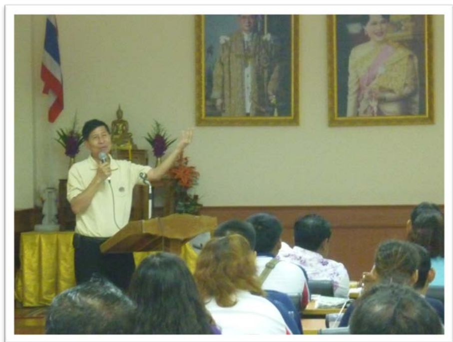
นายวรารุณ ปิ่นเงิน รองผู้ว่าราชการจังหวัดระยอง