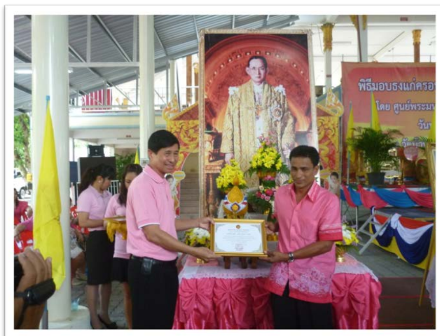
มอบประกาศเกียรติคุณแก่หมู่บ้านนำร่อง