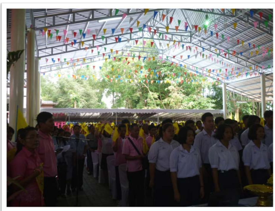
ร่วมกันร้องเพลง ปิดหลังพระ ตัวแทนหมู่บ้าน มอบของที่ระลึกแก่ประธานพิธี