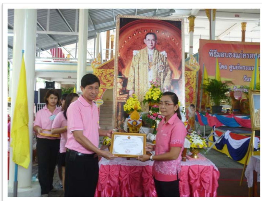
มอบประกาศเกียรติคุณแก่หมู่บ้านนำร่อง