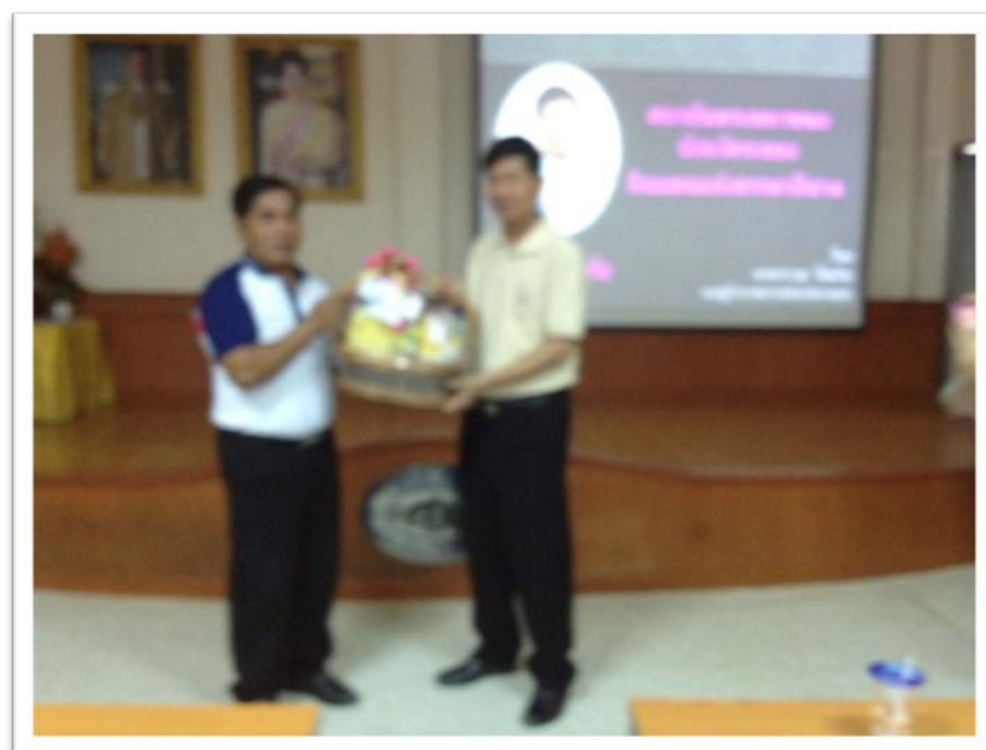
นายกองค์การบริหารส่วนตำบลตะพง มอบของที่ระลึก